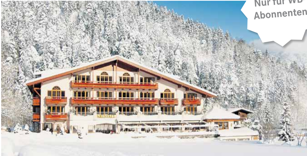
Winterliches Hotel Kristall.

Im Verwöhnhotel Kristall erleben Urlaubsgäste nicht nur die meisten Sonnenstunden im Jahr, sondern vor allem ein Rundum-Verwöhnprogramm für die Seele. Das Naturschutzgebiet Karwendel und das Rofangebirge locken mit wunderbarer landschaftlicher Schönheit. Wenn zarte Schneeflocken um Berg und See niederschweben und die Tiroler Bergwelt weiss einhüllen, werden Winterträume wahr. Für Wintersportler bietet das Skigebiet Karwendel Schneevergnügen pur. Ob leichte blaue Piste, mittelschwere rote oder schwere schwarze Piste für Profis: In der Region Achensee findet man für jedes Können und jeden Anspruch die passende alpine Herausforderung! Die Romantik kommt beim Urlaub im Verwöhnhotel Kristall nicht zu kurz: Das nächtliche Funkeln der Schneekristalle erleben Gäste bei einer romantischen Kutschfahrt durch die verschneite Märchenlandschaft, einer Fackelwanderung auf die Alm oder bei Schneeschuh-Wanderungen entlang des Sees oder über die mehr als 150 km lan-