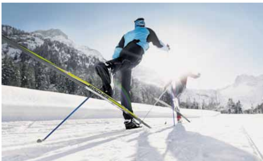
Langlaufen am Achensee.